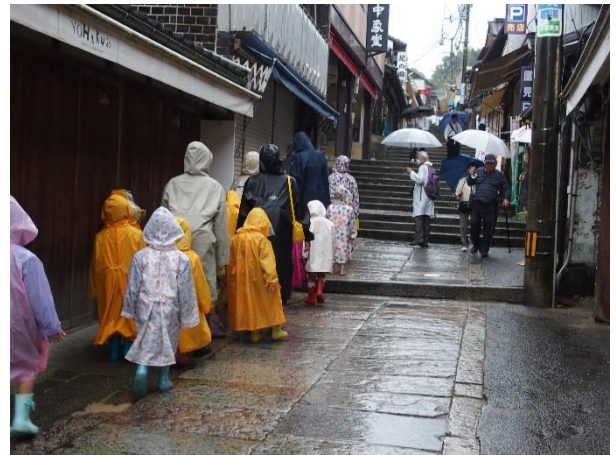
(金刀比羅宮 雨の階段)

最初は、ゴールドタワーのソラキンへ。私にとっては初めてのゴールドタワーでした。北には瀬戸内の島々、東には瀬戸大橋に繋がるJR瀬戸大橋と坂出に向かう予讃線の線路が大きな三角形をつくっていました。