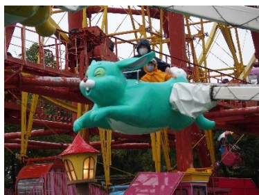
（ファンシーフライト）