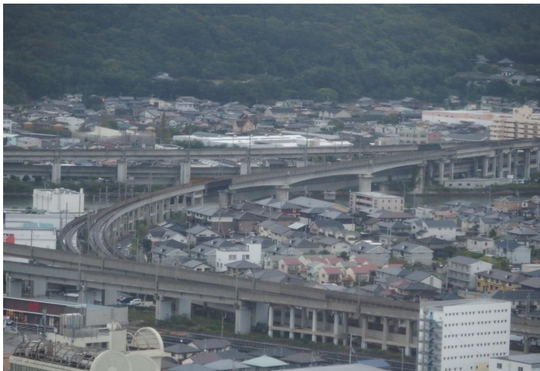
(東 瀬戸大橋に繋がる2本の鉄路 真ん中のカーブが坂出に向かう予讃線)