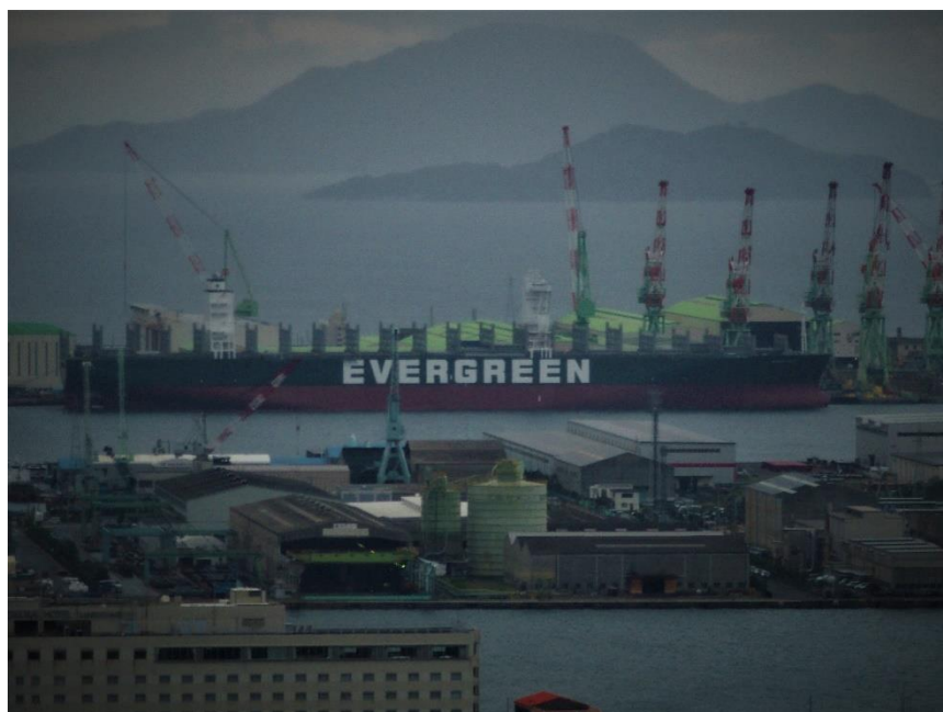
(西に見える造船所)

ゴールドタワーからの眺め、イルカショーで頑張るイルカたち、そのイルカを育てている人たち感動の場面もありました。