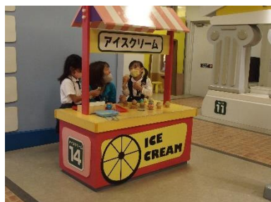
（アイスクリーム屋さん）

乗り物は、乗るのに制限があり大人一人に子どもが一人か二人です。私は「ファンシーフライト」（動物が支柱を中心にくるくる回り上下します）に乗り、その後、「レッツゴトーマス」（機関車に引かれる客車が遊園地の中を一周します）に乗りました。運転している人が、途中で手を振り、それに応えて手を振ってくれるのが印象的でした。