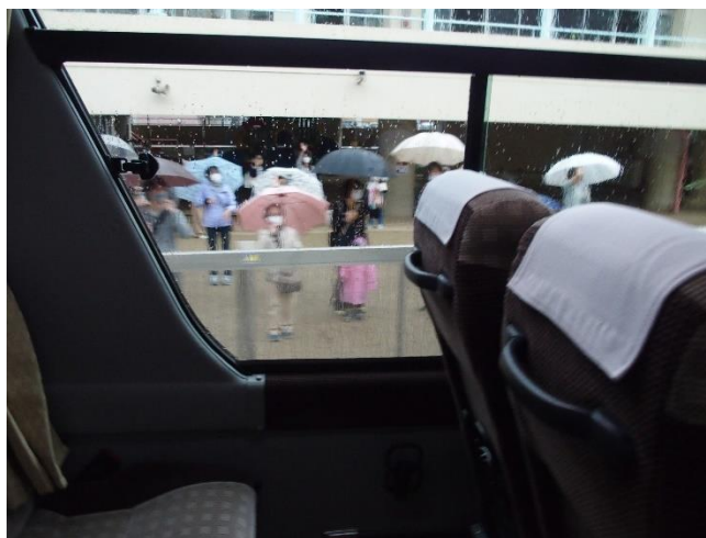
（雨の中のお見送りありがとうございました）

子どもたちは2つのグループに分かれて、ごっこタウンへ行くグループと、乗り物に乗るグループとに分けられました。